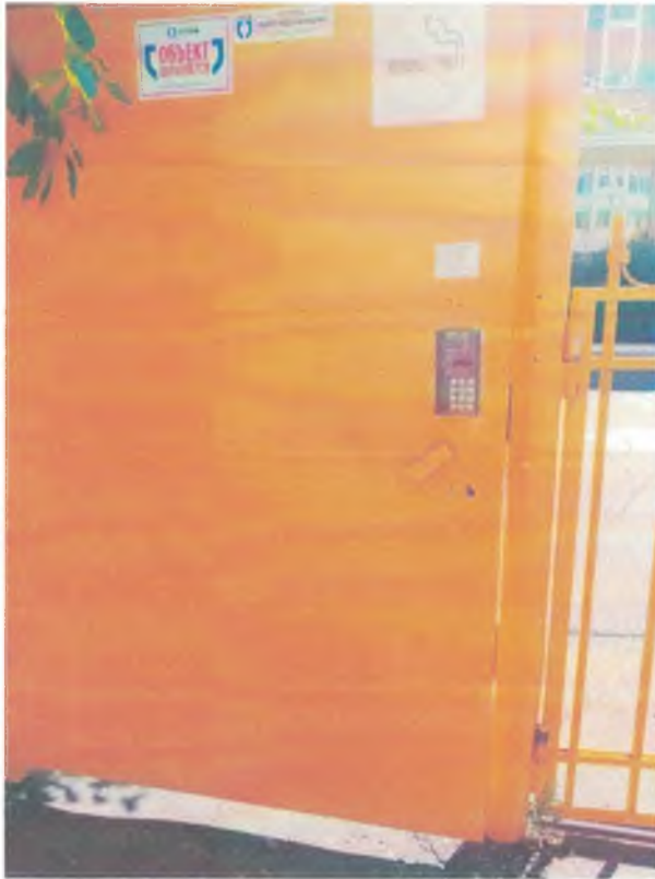
Фото 1 Вход на территорию